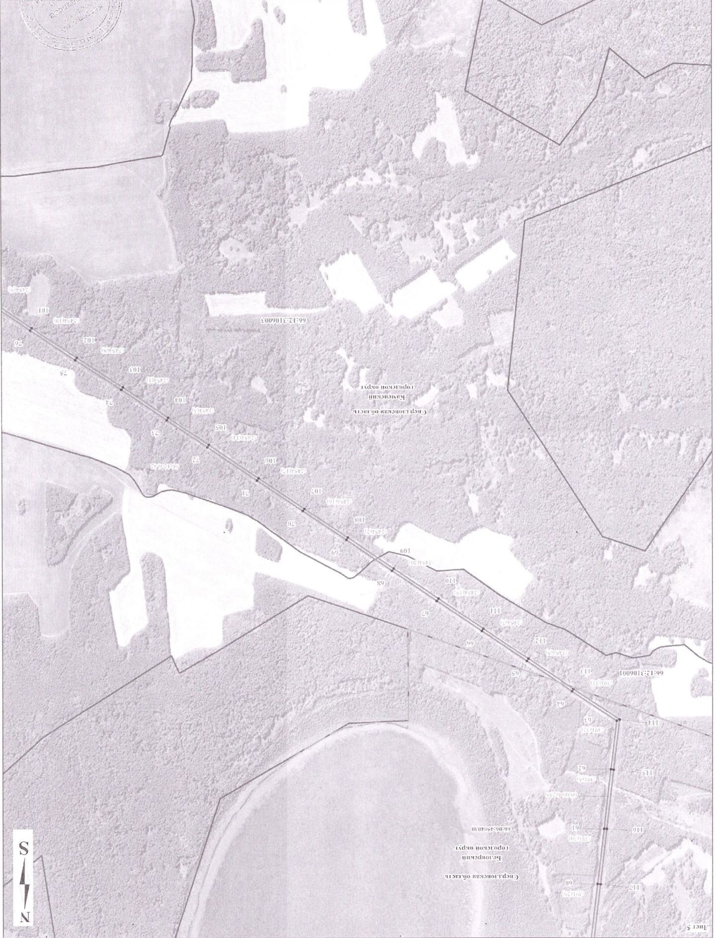
Схема расположения границ рыбного севртыта

Условные обозначения представлено на листе Общеплан схема